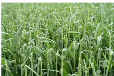
Billede 1. Haglskade i hvede den 23. maj 2014.

Nedenfor ses billeder af haglskader i hvede, vinterbyg og vinterraps.