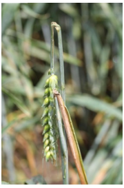
Billede 4. Haglskade i hvede.