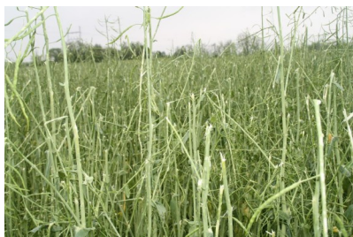
Billede 2. Haglskade i raps den 23. maj 2014.