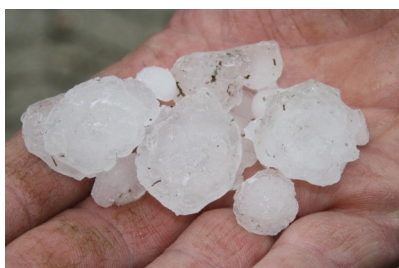
Billede 3. Hagl fra den 23. maj 2014.