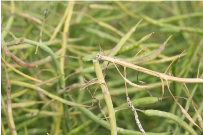
Billede 15. Knækkede stængler som følge af hagl.