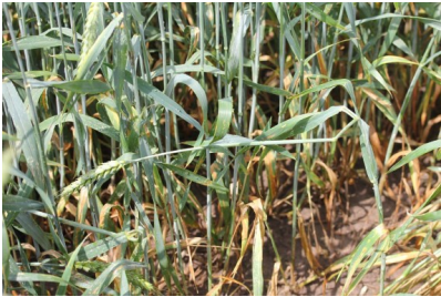
Billede 6. Haglskade i hvede.