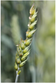
Billede 5. Haglskade i hvedeaks.