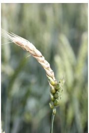
Billede 8. Nødmodne småaks som følge af hagl.