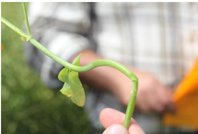
Billede 12. "Pibedannelse" i vinterraps som følge af hagl.