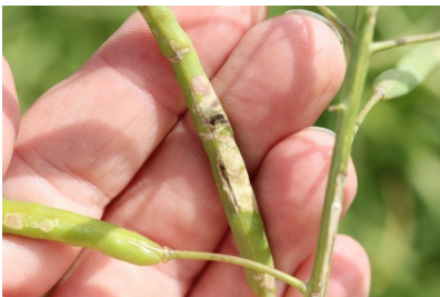
Billede 16. Slagmærker efter hagl på skulperne.