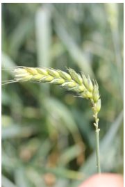
Billede 7. Krumme aks i hvede som følge af hagl tidligere.