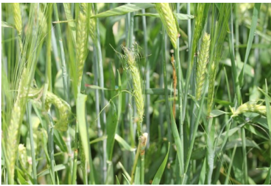
Billede 10. Haglskade i vinterbyg.