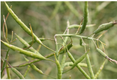
Billede 14. Bøjede stængler som følge af hagl.