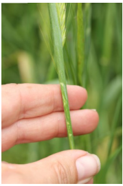
Billede 9. Slagmærker efter hagl på bladskede af vinterbyg.