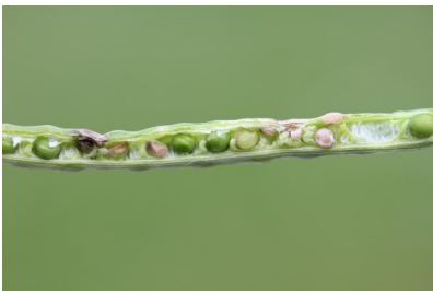
Billede 17. Bag slagmærkerne på skulperne ses skader på frøene.

Læs også: Vejledning til Opgørelse af skader i landbrugsafgrøder