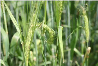
Billede 11. Haglskade i vinterbyg.