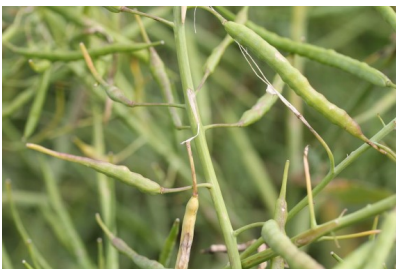
Billede 13. Afslåede skulper i raps som følge af hagl.